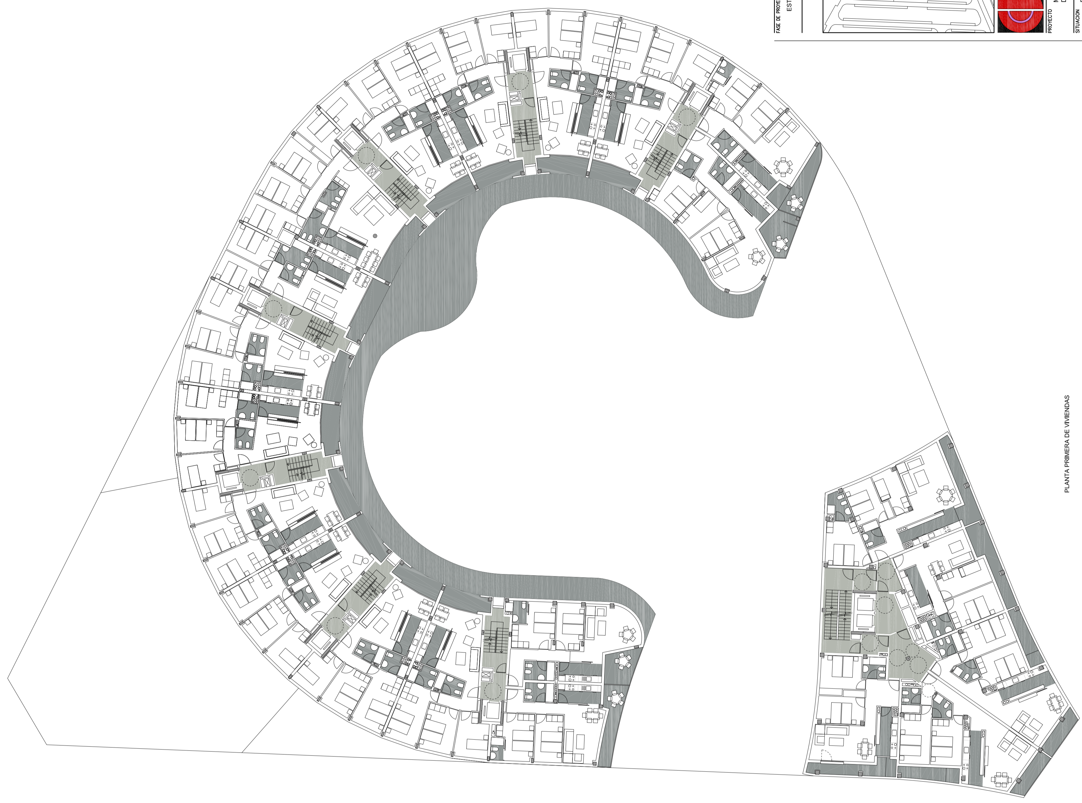
PLANTA PRIMERA DE VIVIENDAS

El presente documento es copia de la original del que se conserva en el archivo de planos de la oficina de Construcciones Urrutia, S.A. y no debe ser utilizado para fines distintos a los que se indican en el presente documento. No se garantiza la exactitud de los datos contenidos en el presente documento.