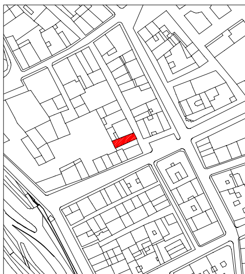
Situación en plano

La fecha de construcción de esta puerta aparece fijada en 1558 y en el contrato también se incluía la realización de una escalera de bajada al "arenal" del Ebro. La desaparición del resto de componentes originales del edificio habría que situarla en los primeros años del siglo XIX como la de otras puertas de la ciudad. Posteriormente se adosó el edificio actual, prácticamente arruinado, del que el cubo formaliza la fachada trasera y marca su fondo de parcela.