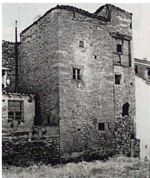
El torreón con la construcción adosada ya desaparecida