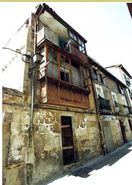
Fachada a la calle del Olmo