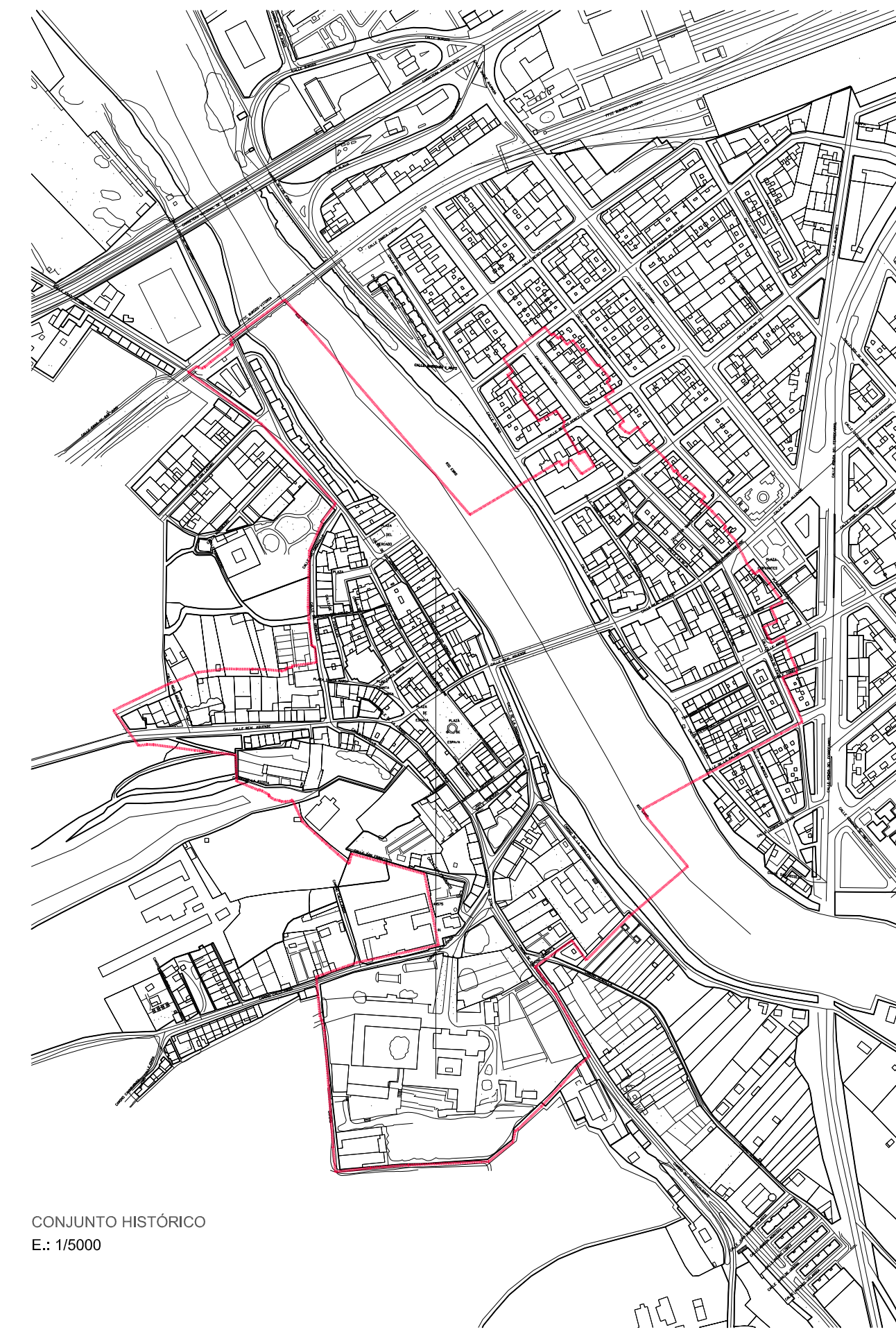
CONJUNTO HISTÓRICO E.: 1/5000

proyecto PROPUESTA URBANÍSTICA título MODIFICACIÓN PGOU MIRANDA DE EBRO QUE IMPLICA MODIFICACIÓN PERI CONJUNTO HISTÓRICO situación MIRANDA DE EBRO promotor JUNTA DE COMPENSACIÓN plano SITUACIÓN EMPLAZAMIENTO CONJUNTO HISTÓRICO fecha OCTUBRE 2009 escala 1 / 20000 - 1 / 5000