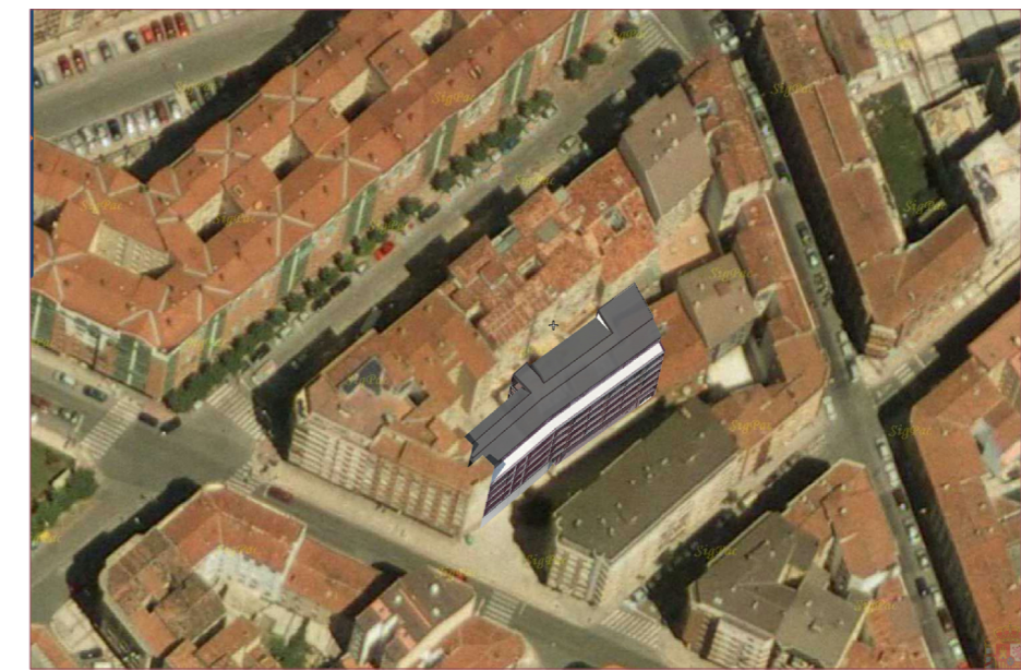
VISTA AEREA + PROPUESTA