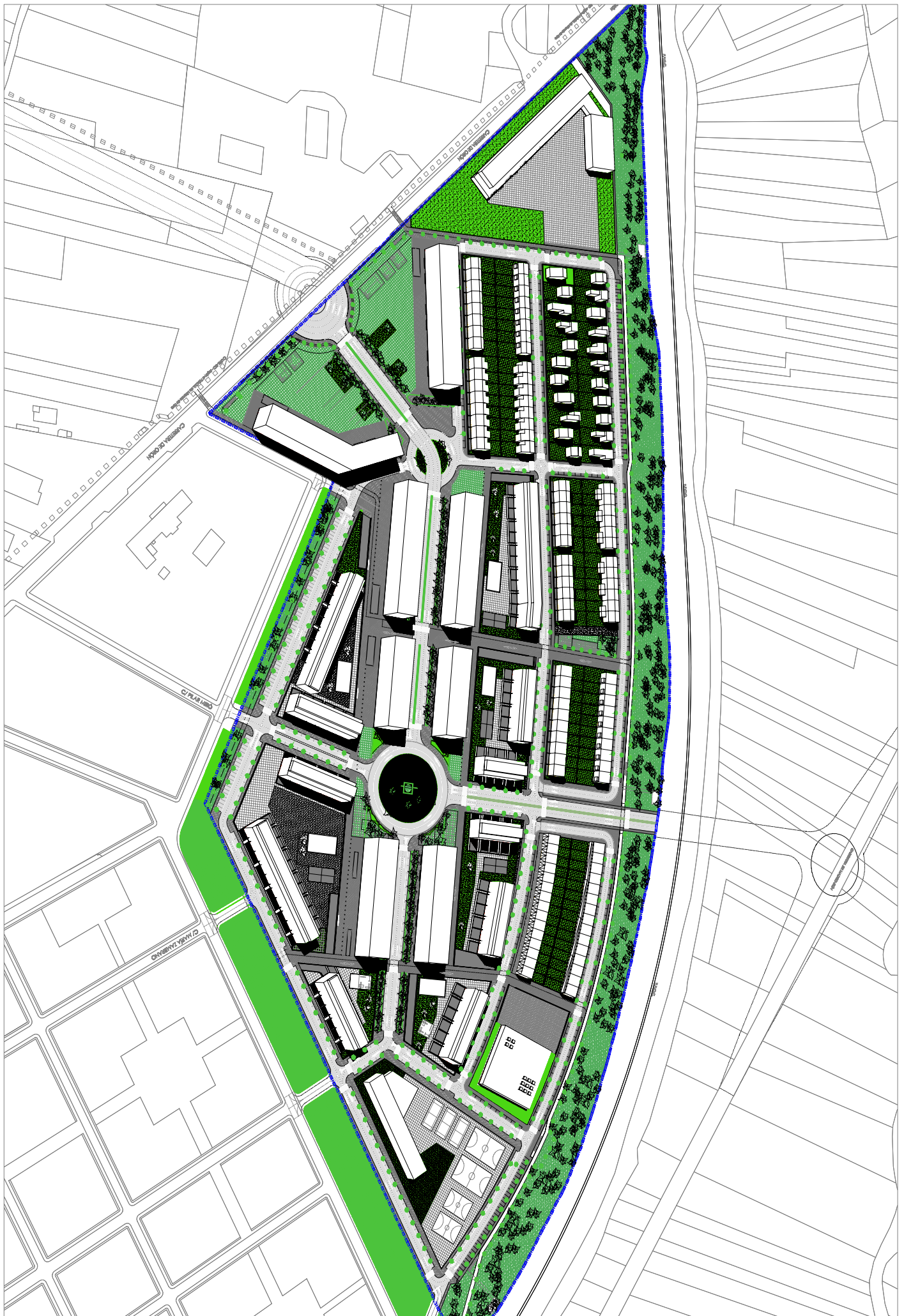
IMAGEN FINAL ORIENTATIVA TRIDIMENSIONAL - 1