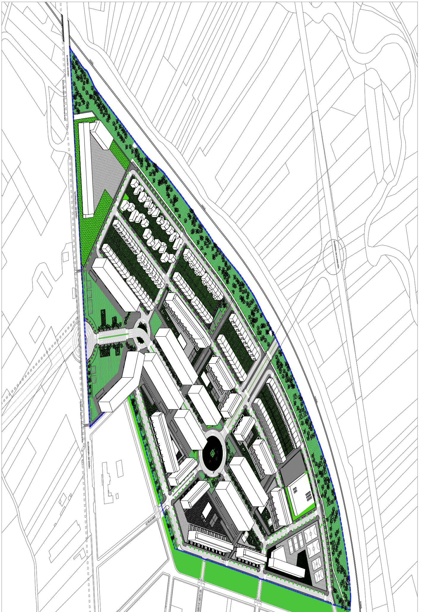
IMAGEN FINAL ORIENTATIVA TRIDIMENSIONAL - 2