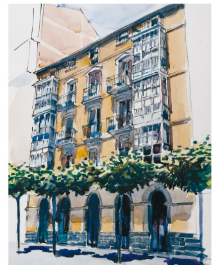
La Estación, 9

la calle Estación con la de Francisco Cantera se caracteriza por la simplicidad arquitectónica frente al decorativismo de la fase anterior, el uso de nuevos materiales que se combinan buscando efectos de claroscuros y la preferencia por la línea recta. Su importancia es clave en la arquitectura mirandesa al ser uno de los primeros ejemplos de este estilo y además de los más puros dentro del panorama regional.