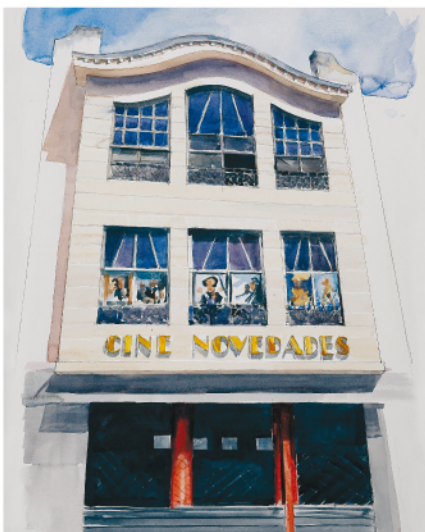
Real Allende, 9

Iniciamos el recorrido en la calle Real Allende nº 9 donde vamos a encontrar el edificio actual del Cine Novedades (1), construido por Fermín Álamo en 1.931 y en el que todavía la tradición está presente en la concepción de la fachada. Siguiendo la calle llegamos a la esquina con Leopoldo Lewin, lugar desde donde se inició el primer Ensanche de la ciudad. En este punto visitaremos un edificio en esquina construido en la segunda