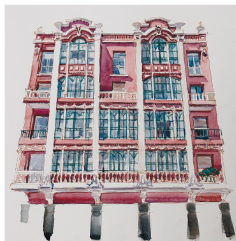
Los Almacenes, 5

más adelante, en el cruce con la calle Pérez Galdós (7) el mismo arquitecto construyó un edificio en 1.934 de corte racionalista. Presenta una fachada limpia, de líneas rectas y con un cuerpo volado en esquina a modo de miradores sin apoyos, típico de los proyectos de este momento. Continuando con nuestro recorrido en la esquina con la calle Ciudad de Toledo nos encontramos un edificio de 1.921, de inspiración modernista, (8), caracterizado por la ligereza de líneas y la concepción decorativa de los elementos sustentantes. En la esquina opuesta, observaremos una construcción ecléctica fechada en 1.935 (9) con miradores de fábrica que presentan formas distintas. Desde allí nos dirigiremos hacia la calle de los Almacenes, atravesando la calle Carlos III. En el número 5 (10) visitaremos la conocida popularmente como “Casa de los cuernos” por los