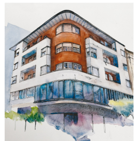
Francisco Cantera, 2

remates de cabezas de toros que la coronan. Fue construida por Fermín Álamo en 1.926 en estilo historicista. Destacan sus miradores de fábrica plenamente integrados en la fachada. Nuestra próxima parada será la calle de la Estación, adonde iremos después de atravesar la calle por la que antiguamente discurría el ferrocarril. Allí veremos en primer lugar, situado en el número 9, un edificio de estilo ecléctico de 1.922, (11) claro ejemplo de la nueva etapa de pérdida progresiva de elementos decorativos que en Miranda se extiende hasta 1.927. Posteriormente, nos detendremos en la contemplación de uno de los ejemplos más interesantes de la arquitectura racionalista que tenemos en la ciudad. Tras la construcción del edificio del Cine Novedades el cual a pesar de su funcionalidad todavía conserva elementos decorativos, Tomás Bilbao construirá en 1.931 (12) el primer ejemplo de arquitectura racionalista en la ciudad. Situado en la confluencia de