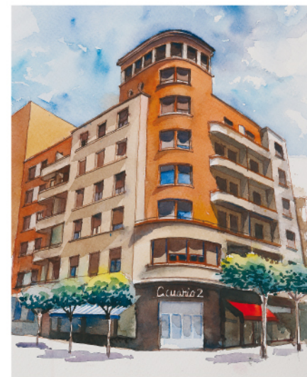
Parque Antonio Machado, 2

Finalizaremos nuestra visita llegando hasta el número 25 de la calle (14) donde nos encontramos con una vivienda unifamiliar, construida en 1.911 y reformada en dos ocasiones (1.950 y 1.998), que constituye una muestra de la arquitectura francesa de vivienda unifamiliar de finales del siglo XIX y comienzos de XX. Ha sido vivienda particular de la familia Trocóniz, convento de monjas Agustinas y actualmente acoge la sede de la Junta de Castilla y León en la ciudad.