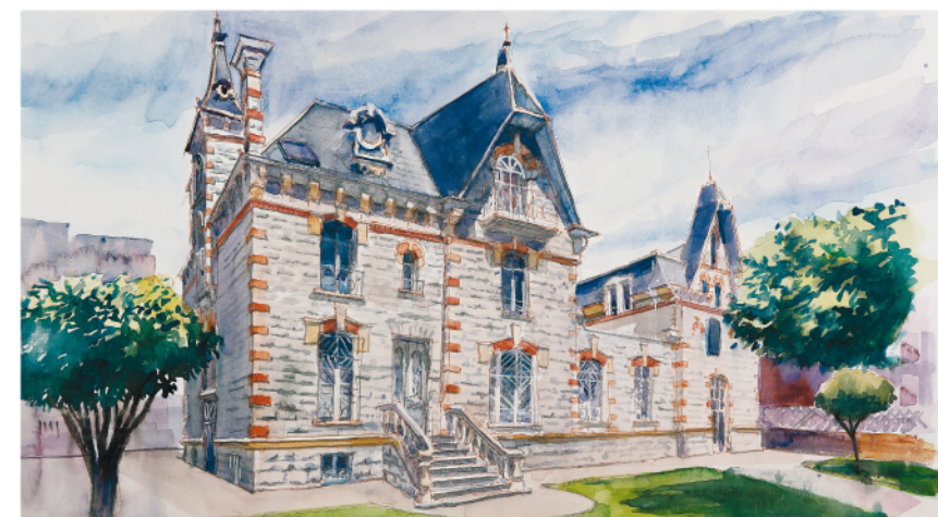
La Estación, 25