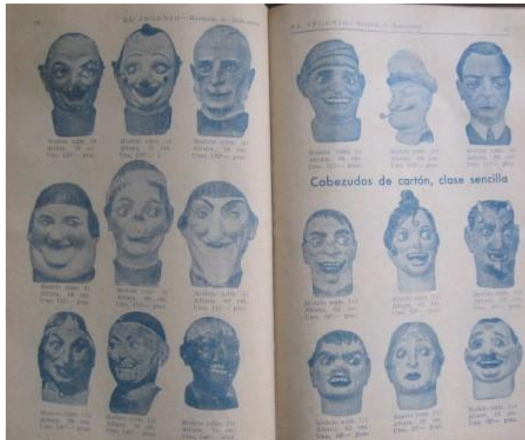
Catálogo de "El Ingenio" modelos de Gigantillos representando al abuelo y la abuela

Hoy en día la mayor parte de estos Gigantes y Cabezudos han desaparecido y los que se conservan se guardan en distintas dependencias municipales. No es grato ver como se han perdido los primeros ejemplares de Gigantes referentes a San Juan del Monte que se estrenaron para animar las Fiestas en el ya lejano año 1942. Estas breves notas queremos que sean recordatorio de la importancia que se daba en aquellos momentos a estos elementos, no dejan de ser pequeñas obras de arte, que desde muy antiguo animaban las fiestas más importantes que se celebraban en las poblaciones españolas.