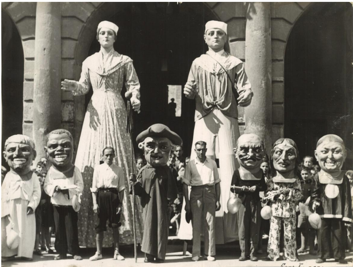
Presentación de la comparsa de Gigantes y Cabezudos en mayo de 1942

Hace 77 años, durante las Fiestas de San Juan del Monte celebradas entre el 21 y el 25 de mayo de 1942, desfiló la primera comparsa de Gigantes y Cabezudos que existió en nuestra Ciudad tras la Guerra Civil, acompañados por unos dulzaineros.