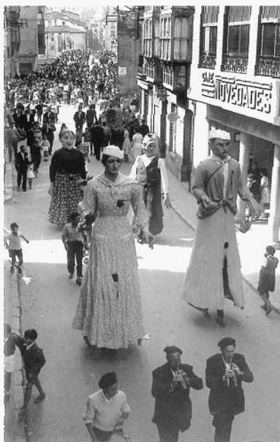
Desfile de comparsa por calle Real Allende

Nuevamente se recurrió a la empresa “ Industrial Bolsera, S.A. ” a la que se hizo el pedido de 1 cabezudo del número 13 del catálogo, otro del número 5bis y tamaño de la serie A y 1 molde para el cabezudo nº 5, todo ello por un importe de 358'25 pts. 8 .